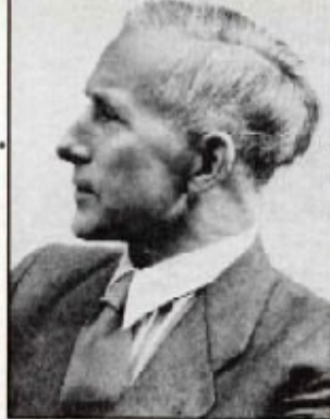
Albert Camus (a sinistra) ed Ernst Junger, due interpreti della figura dell'uomo in rivolta

so il puro assurdo, come in Né qui né là , dove genti annichilite fin nella loro più intima natura, trascorrono il tempo alla stazione in attesa di partire, ma senza sapere dove e senza andare mai davvero in alcun luogo. La sala d'aspetto, in questo modo, diventa una sorta di purgatorio dove tutti i rimossi giungono a compimento, nel naufragio universale della coscienza. Una specie di Aspettando Godot , ma all'incontrario, insomma. Di fronte agli scenari della demenza quotidiana mascherati da normalità, la follia sana e "tradizionale" del Collezionista ci appare un tragico rifugio di